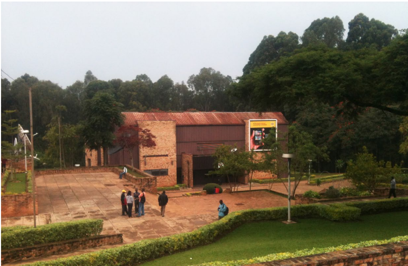
Byggnaden inrymmer University of Rwandas aula. Den ligger på skolans huvudcampus i Butare.

Därtill finns en lärare från Addis Abeba på plats för att medverka vid föreläsningar för att på så sätt bygga upp den lokala förmågan att ta över undervisningen på sikt.