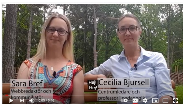
Vad är Encell?